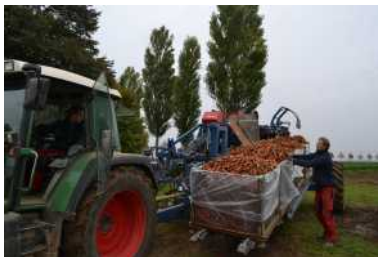
Geerntete Möhren gelangen direkt ins Kühlager.