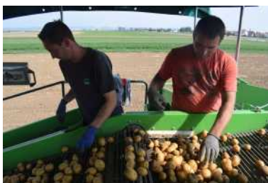
Sorgfältige Sortierung der Kartoffeln direkt nach der Ernte.