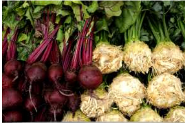
Rote Bete und Sellerie.