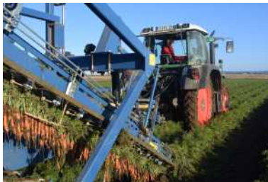
Schonende Möhrenernte mit neuester Technik.